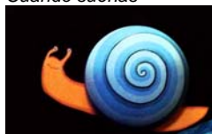
Caleidoscopio Teatro Cuando sueñas