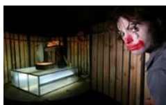
Zirkus Frak Anderdesi