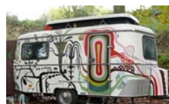
Puck Cinema Caravana Puck Cinema Caravana