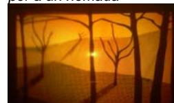
Jaume Tugores Nou llocs per a un nòmada