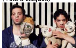
Ateliers de la Colline Los pringados (Tête à claques)