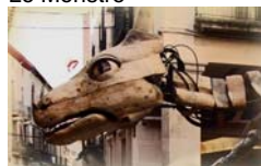
Efímer Lo Monstre