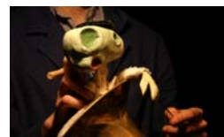
Forani Moguts per l'Ebre