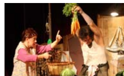
Escarlata Circus Devoris Causa