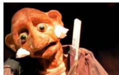
Tro-Héol La mano