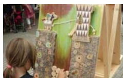
Tombs Creatius Color de monstre