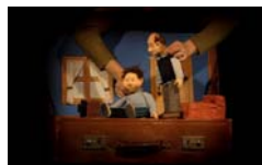
Behibi's El viaje de Mur