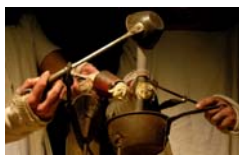
Tête de Pioche Fragments de vida