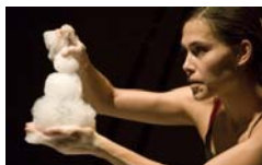
Da.Te Danza Sueña