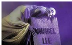
Teatro Corsario La maldición de Poe