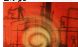
Octagon Productions Energia