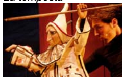
La companyia del Príncep Totilau La tempesta