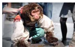
Electric Circus El Mono