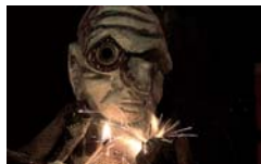
Hermanas Trapp Max y Moritz