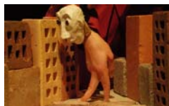
Singes Hurlleurs El Papalagui