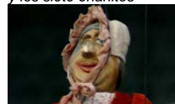
Teatr Viti Marcika Blancanieves y los siete enanitos